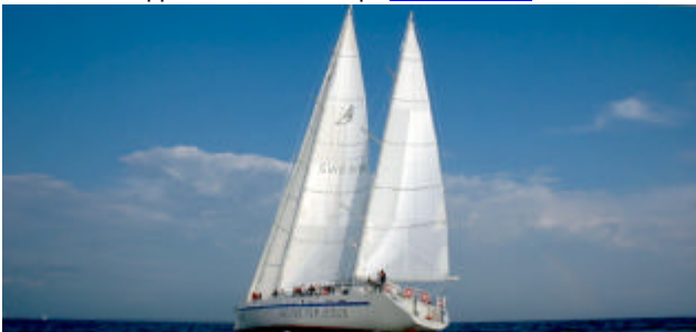
Mot målet i Marstrand för fulla segel

För Dig som också vill uppleva riktig segling finns möjligheter till det. Den 20 september disponerar vi ElidaV hela dagen. Se programmet på www.viker.se och anmäl Ditt intresse. Det finns c:a 40 platser. Vi kommer bl.a. att visa GARMIN GPS på båten.