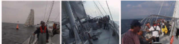
Rundningen vid boj 2 tillsammans med vinnarbåten HiQ var en helt enastående upplevelse. Se video på www.viker.se

Den 11 augusti blev dock jungfruseglingen äntligen av på ett verkligt tufft sätt. Första segelsättningen var på startlinjen till Göteborg Ocean Race med 35 mans besättning. Visserligen dryga två timmar efter de övriga sexton medtävlande båtarna, och därför utanför själva tävlingen. Men det tog bara tolv timmar innan vi i gryningen var i kapp huvudklungan ute vid Skagens rev.