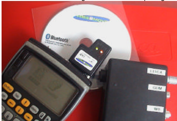
Bluetooth/RS232-Kit för bl.a. fjärrstyrning av totalstationer.

För tre år sedan tog vi tillsammans med företaget Free2Move i Halmstad, fram nya generation av Bluetooth-pluggen för RS232-kommunikation. Den är försedd med praktiska lysdioder och kan anslutas direkt till 12V. Första och andra upplagan tog fort slut, men vi har fortsatt alltid i lager och kan leverera på dagen.