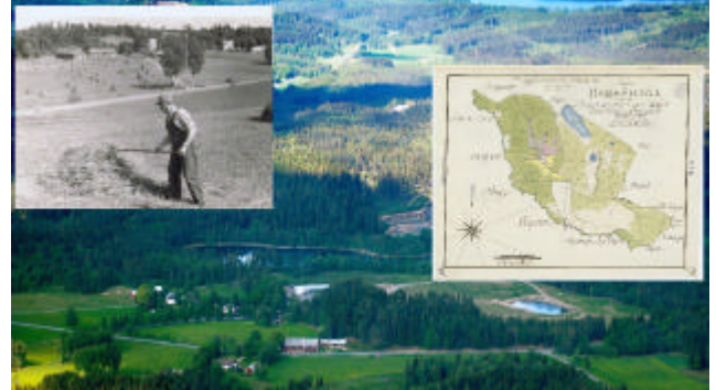
Några bilder från föreläsningen.

småländska höglandet men har anknytning till såväl vår huvudstad som till Uppsala där MÄTKART gick av stapeln