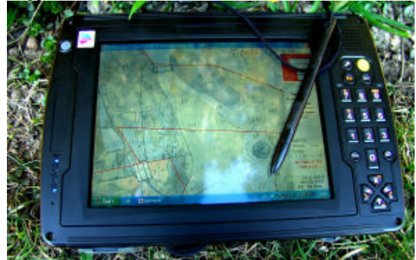
Bilden är tagen utomhus i fullt solsken med klarblå himmel.

Det blev en naturlig koppling till smålänningen Carl von Linné till vars minne vi firade 350 år och som slutade sina dagar i Uppsala. Vid föreläsningen används och presenteras nedanstående "ruggade" Tablet-PC. Den heter Twinhead T8N.