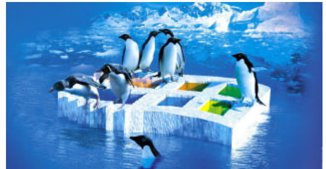
Det flyter faktiskt ganska bra

Vi håller på att skaffa oss erfarenhet av att köra Linux i kombination med Windows. Många har upptäckt fördelarna med öppen programvara. Man har inga kostnader för programlicenser. Windowsanvändare kan i Linux välja gränssnitt som känns bekanta. Utvecklare kan välja programutvecklingsverktyg helt efter tycke och smak. Den grundläggande filosofin är att vi som utvecklar program, delar med oss av erfarenheter och kan utnyttja varandras kod. Det är inte tillåtet att låsa upp användare med licensavgifter. Däremot tar man som datakonsult betalt för tjänster som är förenade med utveckling, utbildning, installationer etc. Men så är det ju även i Microsoft-världen dessutom. Många tror att LINUX får sitt genombrott i år. Microsoft har insett faran och Bill Gates har tagit hjälp av självaste president George Bush för att skydda sina domäner. Det pågår en strid mellan Microsoft och EU i dessa frågor. Ni kan följa detta på vår hemsida.