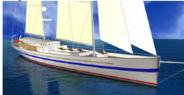
Elida V har 60 kojplatser och tar 150 passagerare.

Under maj månad 2006 planeras sjösättningen av denna unika segelbåt. Lagom för att ta emot jordenruntseglarna som ju går i mål 17 juni i Göteborg. ElidaV är något alldeles extra och helt unikt. Hon är byggd med samma skrovlinjer som de snabbaste tävlingsbåtarna Skillnaden är att hon är hela 40 meter lång. Stormasten mäter 45 meter Mesanen är 33 meter. Fartresurserna för segel blir enorma.