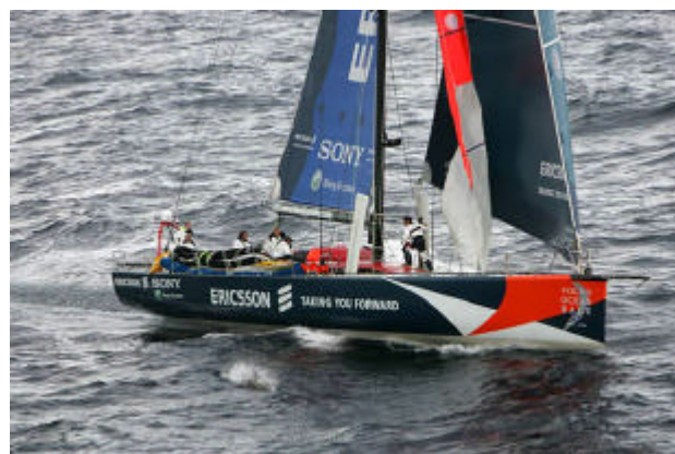
Åter på norra halvklotet

Efter många äventyr har nu båtarna seglat ett varv runt jorden på södra halvklotet. Den 17-18 april angjordes etappmålet i Baltimore. Den svenska båten har väl inte gått så bra som man hoppats, men än återstår ju ett par etapper innan man når slutmålet i Göteborg den 17 juni i år. Då blir det fest igen.