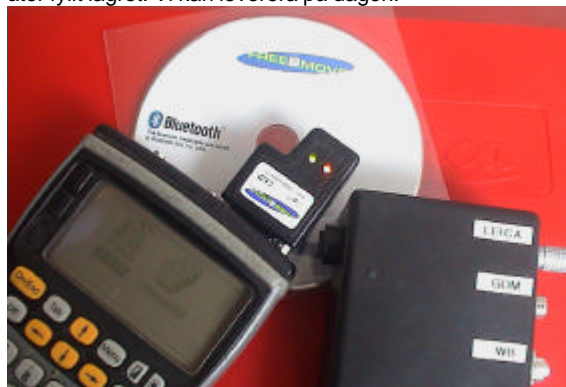
Bluetooth/RS232-Kit för bl.a. fjärrstyrning av totalstationer.

Förra året tog vi tillsammans med företaget Free2Move i Halmstad, fram nya generation av Bluetooth-pluggen för RS232-kommunikation. Den är försedd med praktiska lysdioder och kan anslutas direkt till 12V. Första upplagan tog fort slut, men nu har vi åter fyllt lagret. Vi kan leverera på dagen.