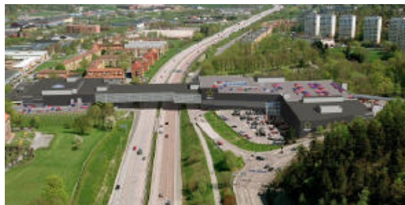
Så här kommer Allum köpcenter i Partille att se ut till våren.

Sammanlagt handlar det om c:a 50.000 m2 butiksytta fördelat på c:a 100 butiker. Det är Sten&Ström Sverige AB som bygger i samarbete med Partille kommun.