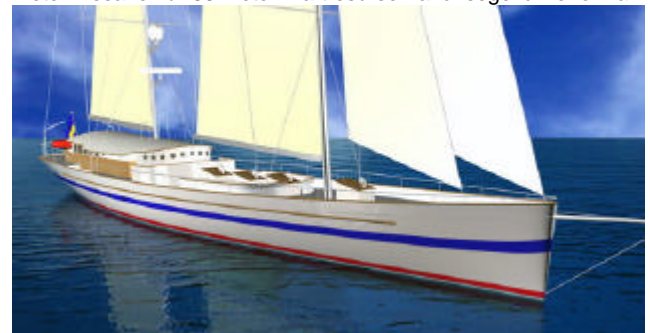
Elida V har 60 kojplatser och tar 150 passagerare.

Den 1 maj 2006 planeras sjösättningen av denna unika segelbåt. Lagom för att ta emot jorden runt seglarna som ju går i mål 17 juni i Göteborg. ElidaV är något alldeles extra och helt unikt. Hon är byggd med samma skrovlinjer som de snabbaste tävlingsbåtarna Skillnaden är att hon är hela 40 meter lång. Stormasten mäter 45 meter Mesanen är 33 meter. Fartresurserna för segel blir enorma.