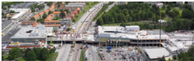
Byggarbetsplats. Vårt kontor syns längst uppe till vänster

Huset där vi har vårt kontor och där posten har sin verksamhet, ska ha förvandlats till butiker. I övrigt vet vi inte så mycket trots att vi sitter mitt i smeten.