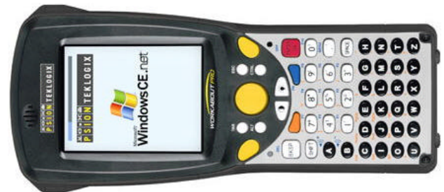
Så här ser den ut det nya handdatorn från Psion Teklogix