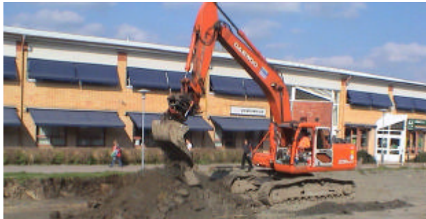
Grävmaskinerna flyttar massor hit och dit hela tiden.

Det är f.n. svårt att beskriva vägen till vårt kontor. Den förflyttas nämligen från dag till dag. Så kommer det att vara ända till våren, då allt ska vara klart. En stor djup grop utanför vår dörr, kommer då att ha förvandlats till en trafikkarusell.