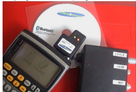
Bluetooth/RS232-Kit för bl.a. fjärrstyrning av totalstationer.

Förra året tog vi tillsammans med företaget Free2Move i Halmstad, fram nya generation av Bluetooth-pluggen för RS232-kommunikation. Den är försedd med praktiska lysdioder och kan anslutas direkt till 12V. Första upplagan tog fort slut, men nu har vi åter fyllt lagret. Vi kan leverera på dagen.