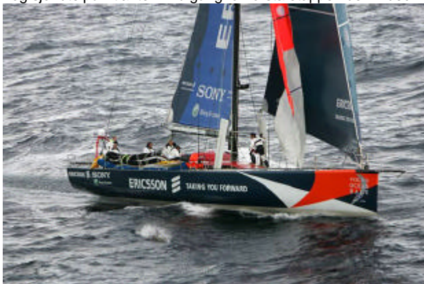
Här c:a 31.200 distansminuter kvar till målet i Göteborg.

Målgången är i Göteborg 17 juni nästa år. Det började bra för den svensk/engelska båten Ericsson som vann första "In Port Race" i Spanien. På den 6400 M långa etappen mot Cape Town ligger de också i täten trots trassel med tampar kring rodret i hård vind och hög sjö ute på Atlanten. Målgång för första etappen den 2 dec.