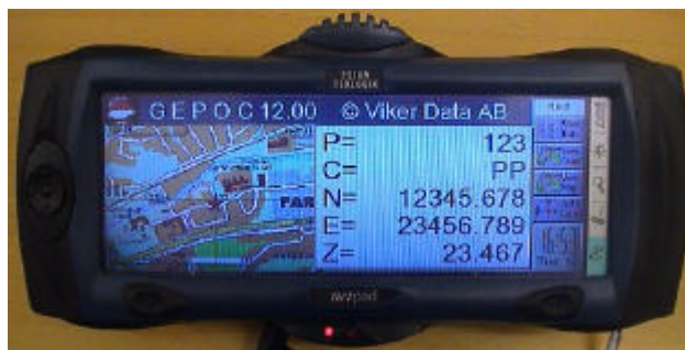
Psion NetPad för den som vill ha större bildskärm. Pro-modellen kan fås med svart/vit eller färg på bildskärmen. Priset blir behagligt på klassiskt Psion-manér. Läs mer på www.pSIONteKlogix.com .