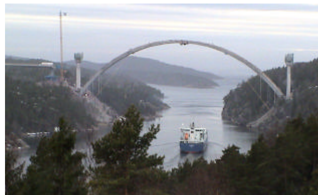
Svinesundsbron i mars. Det var fest då bågen göts samman. Våra förbindelser med Norge blir bättre och bättre för varje dag. Nästa sommar kommer vi att kunna köra bil på den nya vackra bro över Svinesund som ska förena våra länder. Så här såg det ut i slutet av mars då bågen just blivit klar. Bron ska invigas lagom till 100-årsjubileet av unionsupplösningen 1905. Snart har vi motorväg hela vägen mellan Köpenhamn och Oslo via Malmö och Göteborg.

Samarbetet med Blinken A/S i Norge utvecklas på ett mycket fruktbart sätt. GEODOS-kurserna under februari-mars samlade hundratals entusiastiska deltagare.