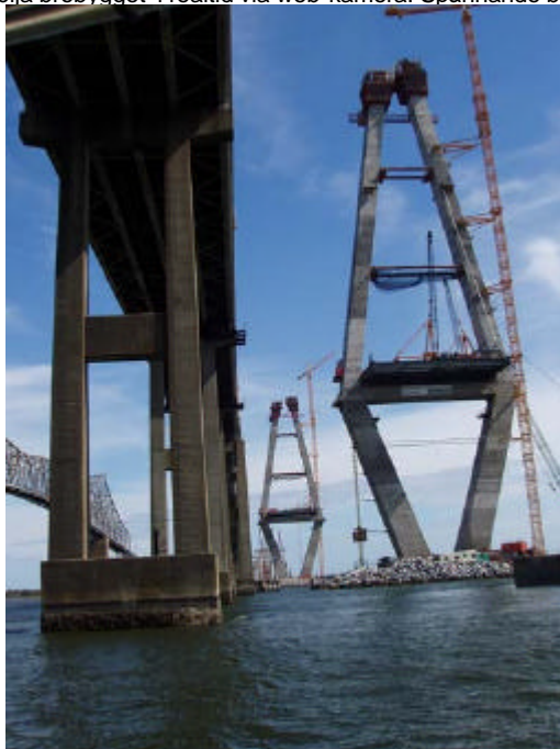
Bild tagen i mars strax innan "diamant-tornen" var klara. Geodos används för direkt kontroll och redovisning av olika detaljers läge och form i tre dimensioner. Kontrollen av den sneda klättermotornen av pylonerna har underlättats med Geodos. Tekniken användes även i Sverige vid byggandet av Uddevalla-bron. Känns designen igen kanske? Fast allt är större i USA.

Brobygget i Charleston fortskrider planenligt. När Du läser detta har de höga lutande pylonerna nått toppen. På vår hemsida kan Du följa brobygget i realtid via web-kamera. Spännande bilder.