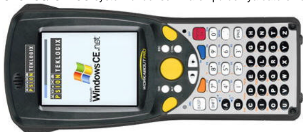
Psion Workabout Pro. Observera likheten med "gamla" MX.

Så här ser den ut det nya handdatorn från Psion Teklogix. Den seglivade klassikern Psion Workabout MX från 1998 får en liten syster i juni. Alla nya Psion-datorer är nu utrustade med operativsystem från Microsoft. För närvarande gäller Windows CE.NET ver 4.2. Förhoppningsvis bör vi kunna leverera ett stabilt GEODOS/ GEPOC-system under sommaren på de nya datorerna.