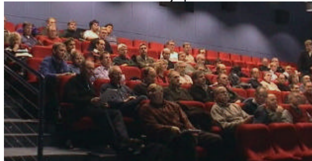
Bilden är från mötet i Ludvika

Med GEODOS och GEPOC blir det smidigt att använda Nätverks-RTK. Vi hjälper Er att komma rätt.