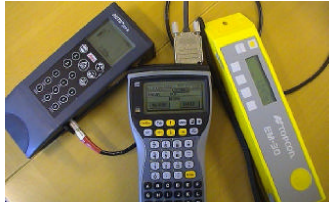
GEODOS med Leicas DISTO eller Topcons EM-30

eftersom vi bedömer att det kan vara användbart för många fler av våra kunder. Det ingår nu i vårt APROG-system och finns fr.om. version 11.72. Det är bara att hämta hem från www.viker.se