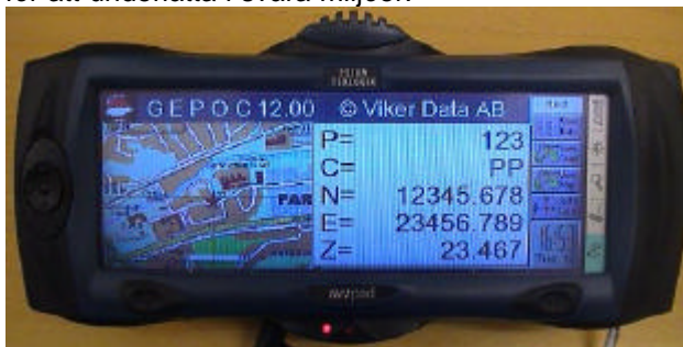
Displayen är uppdelad i fyra olika flexibla delar

Så här ser det ut det nya programmet. De olika fönstren i GEPOC är extremt tydliga och lättlästa. Allt för att underlätta i svåra miljöer.