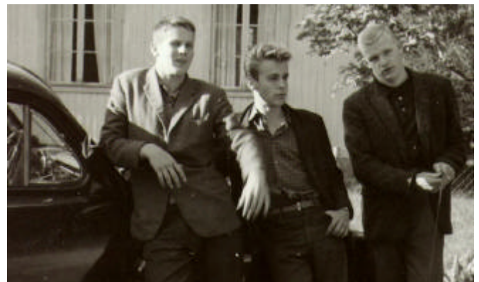
Bilden är från sommarövningarna i Östervåla 1961.