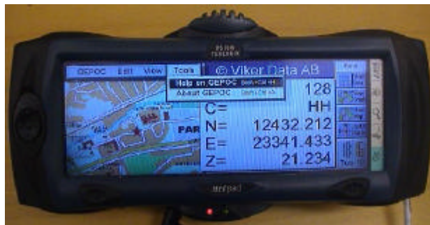
Från huvudmenyn når man den inbyggda manualen.

För att göra uppstart och inställningar mm. kan man använda pekskärmen antingen direkt med fingertopparna, eller med medföljande penna. Grafikfönstret kan användas till kombinationer av rasterbilder, vektorgrafik och guidningsgrafik. På GEODOS-vis kan man enkelt och snabbt växla mellan olika presentationsmöjligheter.