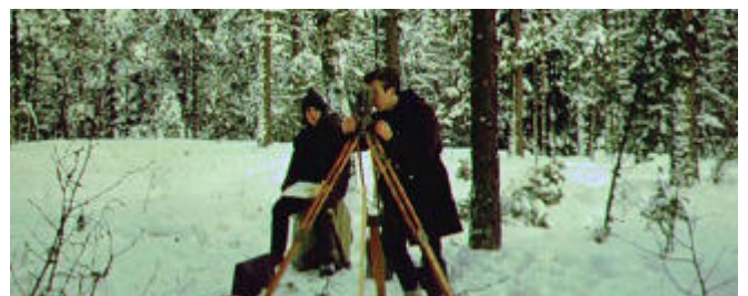
Polygonmätning i Angered vintern 1966