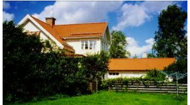
Mäteriets huvudkontor i Bärsta utanför Alunda